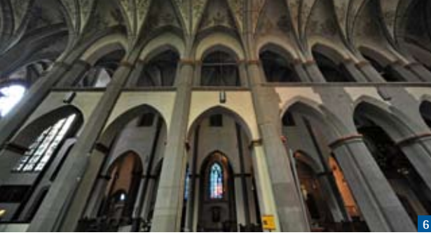
Das Mittelschiff im gotischen Stil entstand um 1330.