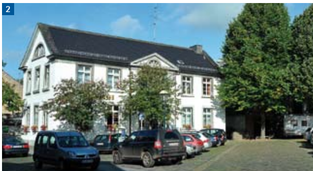
Das ehemalige Rathaus (1830)

Wenn Sie sich auf dem Korneliusmarkt 3 umschaun, sind die höher gelegenen Eingänge der historischen Häuser nicht zu übersehen. Um sich vor Jahrhunderten noch vor dem Hochwasser zu schützen, waren die Häuser nur über Stufen zu erreichen. Heute ist der Flusslauf so verändert, dass der Fluss keine unmittelbare Gefahr mehr darstellt.